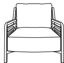
sessel mit armlehnen hochlehner

H 690 - mm B 765 - mm T 800 - mm SH 380 - mm