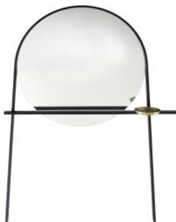
SPIEGEL / STUMMER DIENER